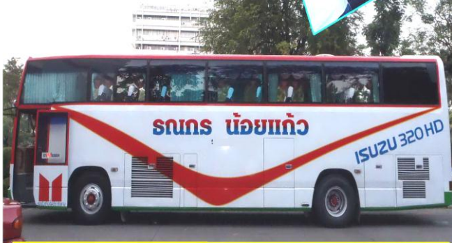
ราคา 20,000 บาท

ติดต่อ Tel.095-6040671 line:marinatourcenter www.trangmarina.com/กาญจนบุรี.html E-mail:marinatourcenter@hotmail.com