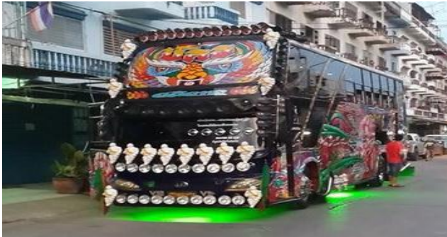
ราคา 17,000 บาท