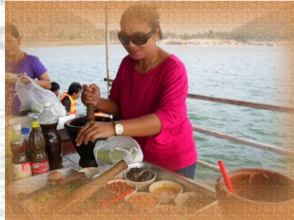
ใครมีฝีมือเชิญนะจ้ะครับ