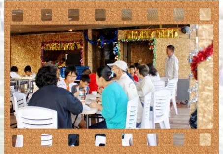
ทานกันบนโต๊ะ

11.30 น. นำคณะล่องแพสู่ เกาะหินกลม ใช้เวลาล่องแพชมธรรมชาติ 2-3 ชม. สนุกสนานกันให้เต็มอ้อมกับการล่องแพชมธรรมชาติของเขื่อนศรีนครินทร์