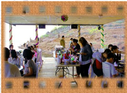
ห้องอาหาร

11.00 น. แพสำราญเขื่อนศรีฯ และเจ้าหน้าที่ จึงดีต้อนรับคณะสู่ทะเลสาบเขื่อนศรีฯ เชิดอันทักที่พัก เจ้าหน้าที่คอยดูแลและบริการทุกท่าน พร้อมอชบางกานูเกณฑ์ต่างๆ และการล่องแพชมธรรมชาติ แพสำราญสองชั้นเคลื่อนตัวสู่ เกาะกลางทะเลสาบ พร้อมบริการอาหารมื้อกลางวันสไตลบุฟเฟ่ มือที่1 1. ปลาราดเต้าเจี้ยว 2. ไก่ทอดเกลือ 3. ลาบหมู/ไก่ 4. ผัดคะน้าหมูกรอบ 5. ซดลิมตำ(ตำก้นเอง)+ขนมจีน 6. ต้มชุปซีโรงหมู 7. ข้าว 8. น้ำดื่ม+น้ำอัดลม 9. น้ำแข็ง ( พิเศษ! เราตั้งใจในดอกกาแพ แพสำราญมีบริการกาแพ ไอวลิตัน เรามีบริการตลอดเวลาเลยจ้ะ )