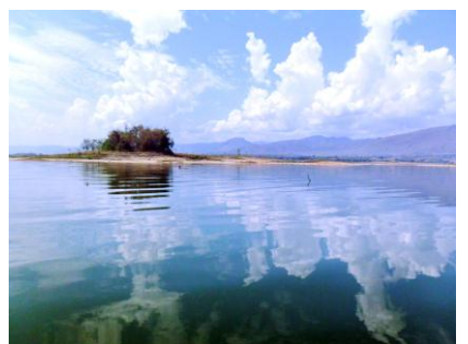
เกาะหินกลม