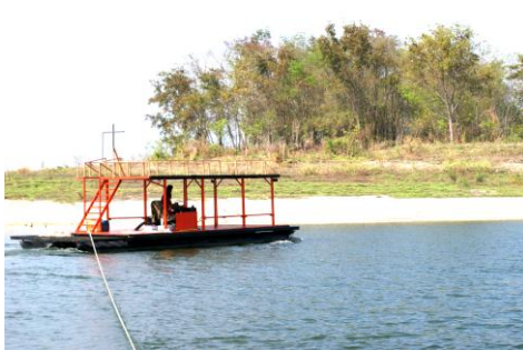
เล่นน้ำ หรือจับชมตามอัชงาด้จ้ะ