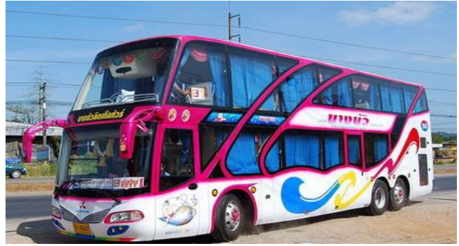
ราคา 24,000 บาท