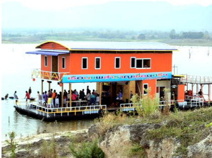
แพสำราญเทียบที่ เกาะหินกลม

15.00 น. ถึงเกาะหินกลม ขึ้นเกาะที่มีหน้าตาร้างและหินก้อนกลม เหมาะเล่นน้ำและจับชมจูดชมวิว ล่องแพไปกอลงเล่นน้ำก็ให้จุใจ หรือ จะต่างรูปแบบบนเกาะเราไม่ว่ากัน นามุมสวยของจูดชมวิว ส่วนทำนใดที่ช่อบร้าสุรา ทั้งเพลง ร้องดาราโอเกะ หรือจะเปิดเซดเซดตามอัชงาด้จ้ะครับ บริการอาหารว่างเสีนหมี่ผัดช้อวด้จ้ะครับ