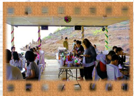
นื่องอาหาร

11.00 น. แพสำราญเขื่อนศรีฯ และเจ้าหน้าที่ จึงดีต้อนรับคณะสู่ทะเลสาบเขื่อนศรีฯ เชิดอันทักที่พัก เจ้าหน้าที่คอยดูแลและบริการทุกท่าน พร้อมอชบาญเณรที่ต่างๆ และการล่องแพชมธรรมชาติ แพสำราญสองชั้นเคลื่อนตัวสู่ เกาะกลางทะเลสาบ พร้อมบริการอาหารมื้อกลางวันสไตลบุฟเฟ่ มือที่1 1. ปลาราดเต้าเจี้ยว 2. ไก่ทอดเกลือ 3. ลาบหมู/ไก่ 4. ผัดคะน้าหมูกรอบ 5. ซดลิมตำ(ตำก้นเอง)+พริกขี้หนู 6. ต้มชุปซี่โครงหมู 7. ข้าว 8. น้ำดื่ม+น้ำอัดลม 9. น้ำแข็ง ( พิเศษ! เราตั้งใจในดอกกาแพ แพสำราญมีบริการกาแพ ไอวลิตัน เรามีบริการตลอดเวลาเลยจ้ะ )