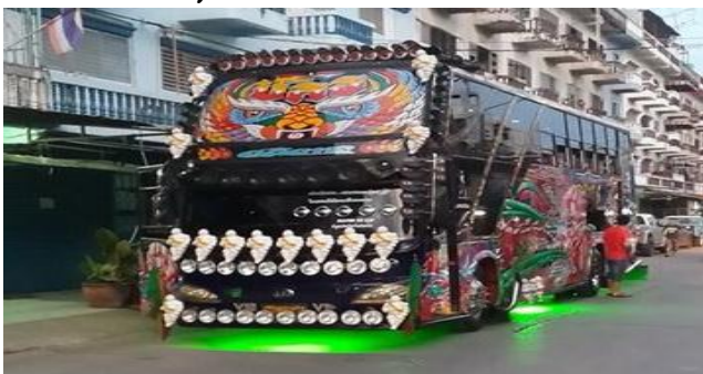
ราคา 17,000 บาท