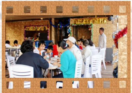
ทานกันบนโต๊ะอาหาร

ล่องแพสำราญในธรรมชาติที่เปี่ยมใจ ท่องเที่ยวรอบเกาะอกมัท สัมผัสวิถีล่องอ่าวทั้งความ ประกอบกับชั้นนึ่งเรียงรายอง่าง เป้นระเบียบ ในแต่ละอ่าวในรูปแบบทั้งดงามที่แตกต่างกัน ชมสน้เขื่อนศรีนครินทร์ จนถึงจุดวิวที่องสถนที่เราจอดแพกันที่นี้ ณ อ่าวน้ำใส