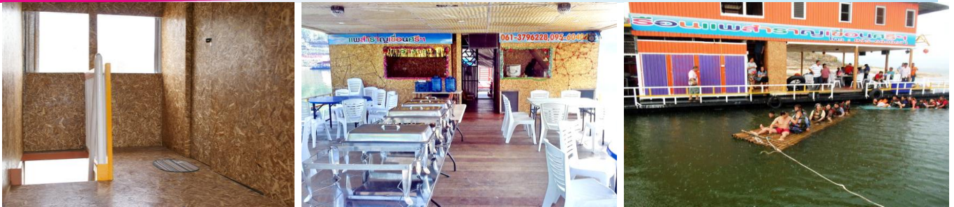
เรือแพสำราญเขื่อนศรีฯ 2 ๆ 32 ท่าน มี 5 ห้องนอน 3 ห้องน้ำ ชั้นล่าง ห้องอาหาร ลานกิจกรรม

ติดต่อ Tel.095-6040671 line:marinatourcenter www.trangmarina.com/กาญจนบุรี.html E-mail:marinatourcenter@hotmail.com