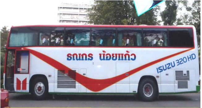
ราคา 20,000 บาท