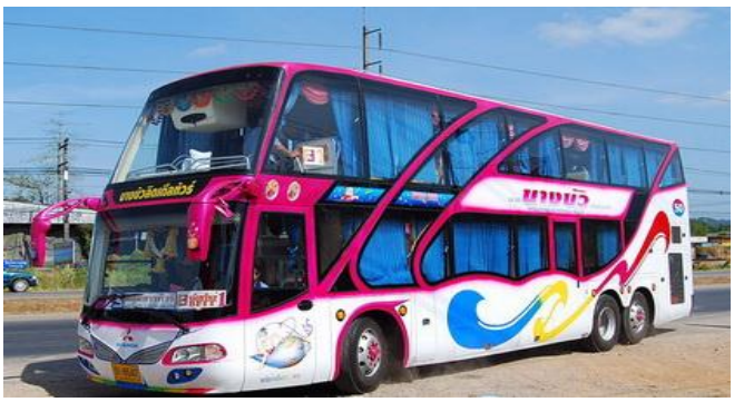
ราคา 24,000 บาท