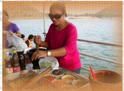
ใครมีฝีมือเชิญมาครับ